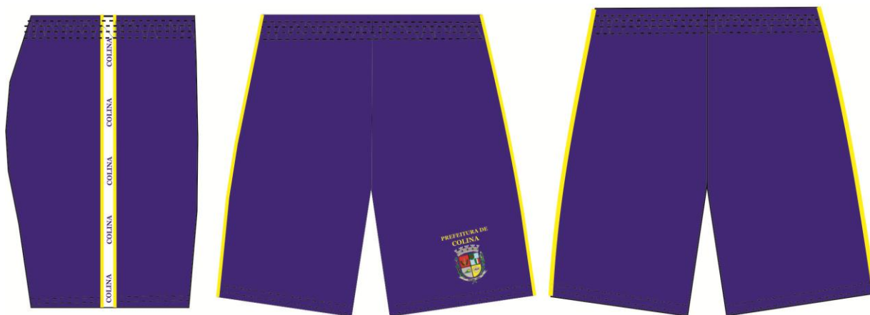
TABELA DE MEDIDAS DA BERMUDA FEMININA: