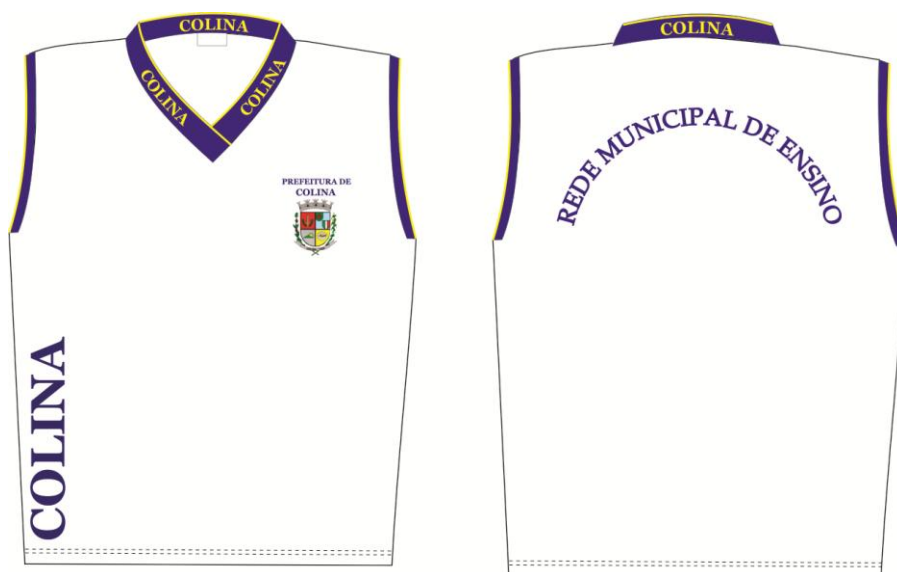
TABELA DE MEDIDAS CAMISETA CAVADA: