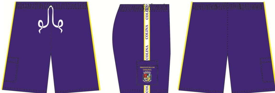
TABELA DE MEDIDAS DA BERMUDA MASCULA:

site: www.colina.sp.gov.br - e-mail: licitacoes@colina.sp.gov.br